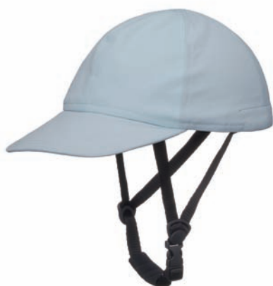
オーク/アクアブルー(oak)