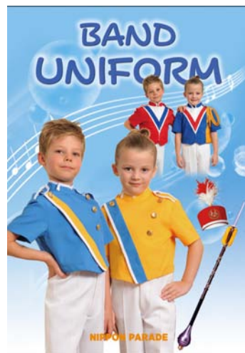
日本パレードの各種製品カタログ