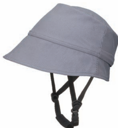
バーチ/ストライプブルー(bich)